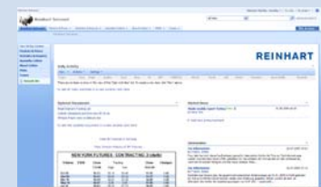
Reinhart Intranet, Version R1